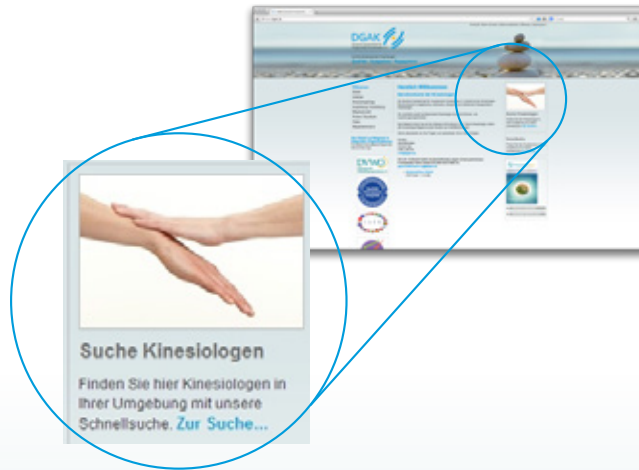
Schnell gefunden als Kinesiologe mit Qualität www.dgak.de