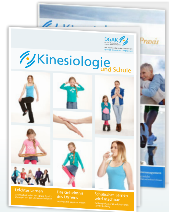
Broschüren verschiedene Anwendungsbeispiele